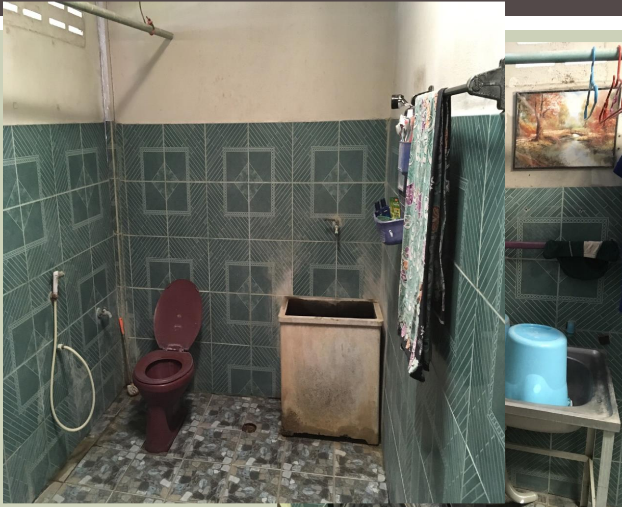
ห้องน้ำสะอาด ไม่มีกลิ่น